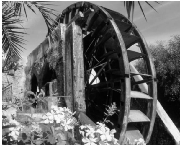
Noria de la huerta murciana

Tal vez hay muchos ciudadanos murcianos que desconocen este dato, pero UPyD fue el único partido que votó en contra de tal Estatuto. Por todo ello, durante el mes de octubre UPyD ha recogido firmas en distintos pueblos de la vega media.