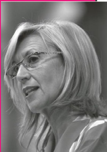
Fragmento del artículo publicado en el blog de Rosa Díez.

http:// amigosdeupydenmolina. wordpress.com/