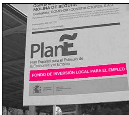
Cartel del Plan E en Molina de Segura