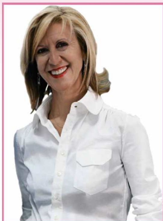
Rosa Díez Portavoz de Unión, Progreso y Democracia